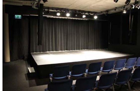
5m x 3m x 0.5m (BxTxH)