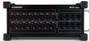
Allen-Heath QU 16 – Stagebox AB168

http://www.allen-heath.com/ahproducts/qu-16/