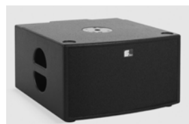
Fohhn LX-150 Linea, XS10 Active Sub http://www.fohhn.com/uploads/media/LX-150_Datenblatt_de.pdf