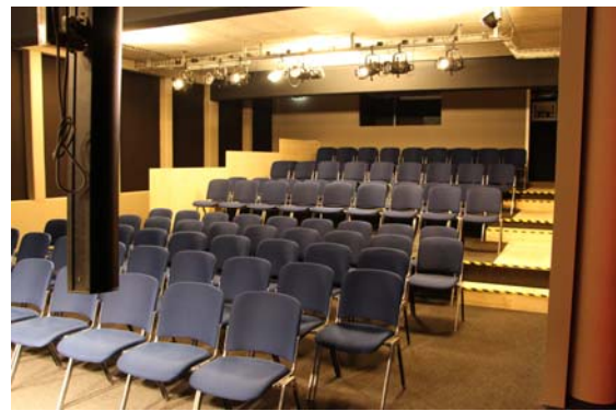
100 Sitzplätze mit Tribüne aufsteigend ab Reihe 5